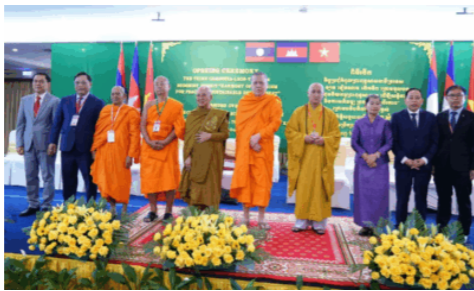
រៀបចំការអះអាងពីការជំរុញកិច្ច សហប្រតិបត្តិការខាងសាសនា ជាមួយកម្ពុជា និងឡាវ