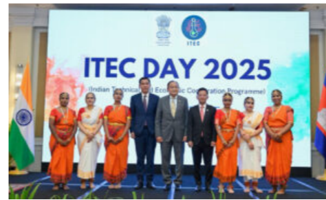
ឥណ្ឌានៅតែជាដៃគូគួរឱ្យទុកចិត្ត ក្នុងដំណើររបស់កម្ពុជាឆ្ពោះទៅសេដ្ឋ កិច្ចមានបច្ចេកវិទ្យាជៀនលៀន