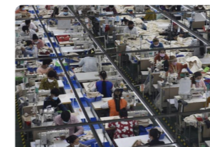
( https://cambodianess.com/article/exports-of-garments-shoes-tavel-goods-surpass-12-bln-in-first-nine-months )

( https://cambodianess.com/article/cambodia-and-the-us-sign-a-wide-ranging-trade-agreement )