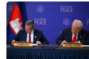
( https://cambodianess.com/article/cambodia-and-the-us-sign-a-wide-ranging-trade-agreement )

( https://cambodianess.com/article/powering-the-future-singapore-charts-regional-energy-transformation-at-siew-2025 )