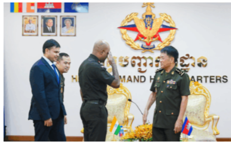
កម្ពុជាស្នើឥណ្ឌាបន្តកិច្ចសហ ប្រតិបត្តិការយោធាបន្ថែមទៀត