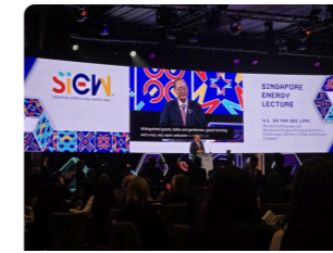
( https://cambodianess.com/article/powering-the-future-singapore-charts-regional-energy-transformation-at-siew-2025 )

( https://www.addtoany.com/share?url=https%3A%2F%2Fcambodianess.com%2Farticle%2Findia-funds-it-center-cambodia&title=India%20Funds%20IT%20Center%20to%20Boost%20Digital%20Literacy%2C%20Buddhist%20Values ) ( /#facebook ) ( /#x ) ( /#telegram ) ( /#pinterest ) ( /#print ) ( /#copy_link ) ( /#whatsapp ) ( /#linkedin )