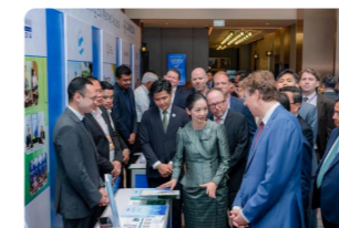
( https://cambodianess.com/article/cambodia-to-unlock-the-european-market-for-smallmedium-enterprises-in-cashew-pepper-industries )

( https://cambodianess.com/article/exports-of-garments-shoes-tavel-goods-surpass-12-bln-in-first-nine-months )