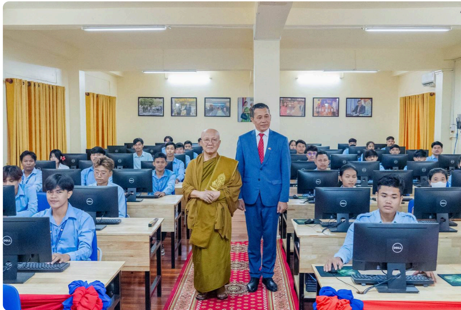
India has funded a new Information Technology Center at Preah Sihamoniraja Buddhist University.

By: Chhuon Kongieng (https://Cambodianess.Com/By_author?Name=Chhuon-Kongieng)