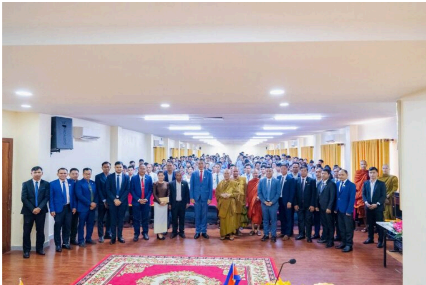
សូមចុច Subscribe Channel Telegram កម្ពុជាថ្មី ដើម្បីទទួលបានព័ត៌មានថ្មីៗទាន់ពេលវេលា

ឯកអគ្គរដ្ឋទូតឥណ្ឌាប្រចាំកម្ពុជាលោក បារីតលុង វ៉ាន់ឡាល់វ៉ាវណា (Bawitlung Vanlalvawna) បានលើកឡើងថា ប្រទេសកម្ពុជានៅតែជាដៃគូដ៏សំខាន់នៅក្នុងក្របខណ្ឌគោលនយោបាយទិសបូព៌ារបស់ឥណ្ឌា ហើយមិត្តភាពរវាងប្រទេសទាំងពីរស្ថិតនៅលើមូលដ្ឋាននៃប្រវត្តិសាស្ត្រ និងទស្សនវិស័យរួមគ្នាសម្រាប់ការអភិវឌ្ឍន៍រួម និងប្រកបដោយចីរភាព។