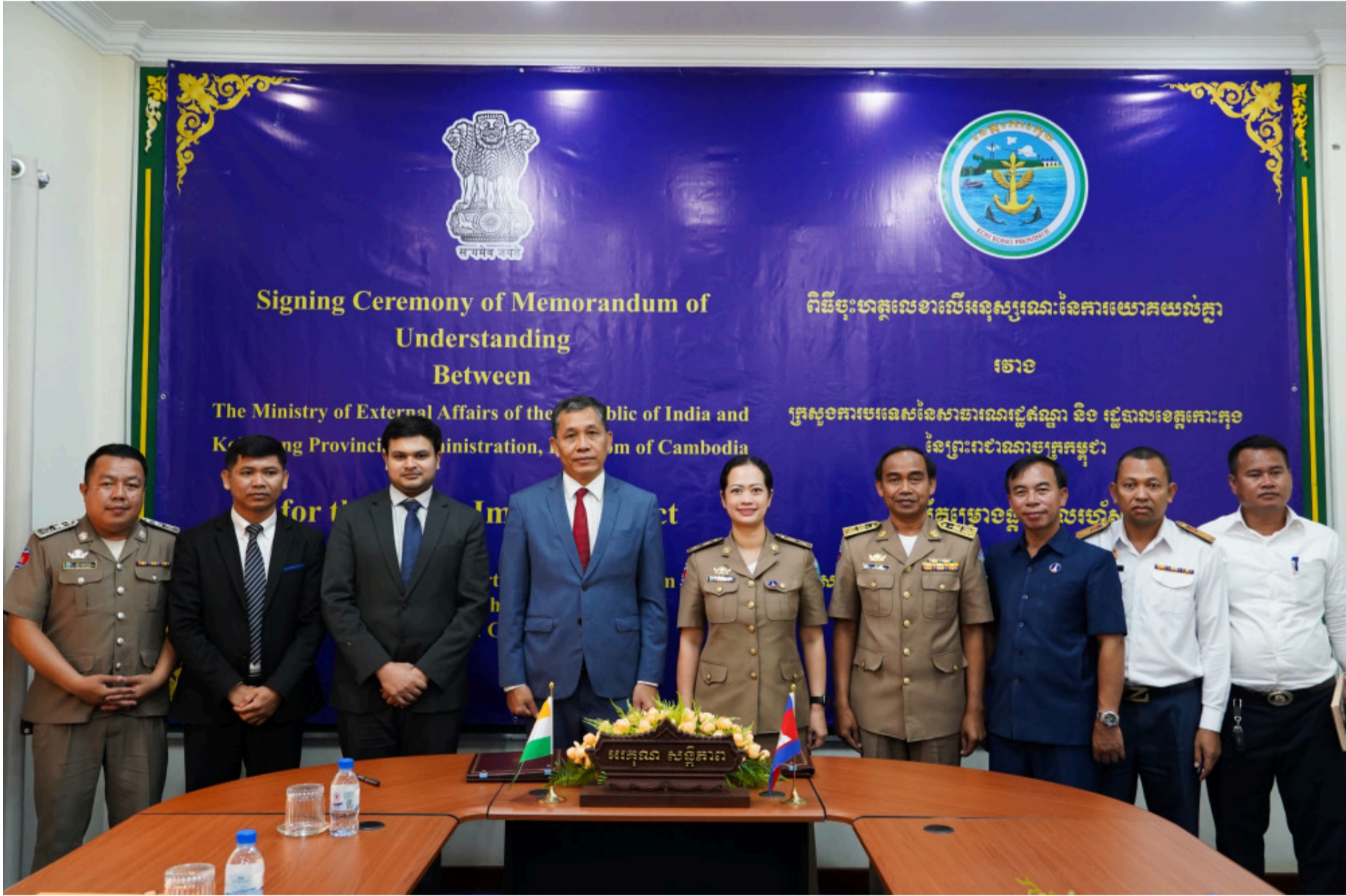
By C. Nika